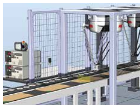
Picking PowerPac用户不用写一行代码。

使用Picking PowerPac，用户连一行代码也不用写，只需选择产品与容器类型，设置好产品与容器的尺寸、模式等简单参数，软件即自动创建可供模拟、测试和微调的程序，不仅节省了宝贵的时间，还能提前验证解决方案的有效性，将任何错误都拦截在生产现场之外。