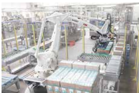
戈亚斯工厂的13条利乐生产线实行每周7天、每天24小时工作制。

过去，Piracanjuba的所有产品均采用人工码垛，约有75名操作工每天重复着单调乏味的体力劳动。为了在巴西这一激烈竞争、价格敏感的市场保持领先优势，Piracanjuba与ABB开始探讨设计一款适应厂房布局并满足生产需求的机器人解决方案，从而帮助公司降低成本，提高效率，优化人力资源。