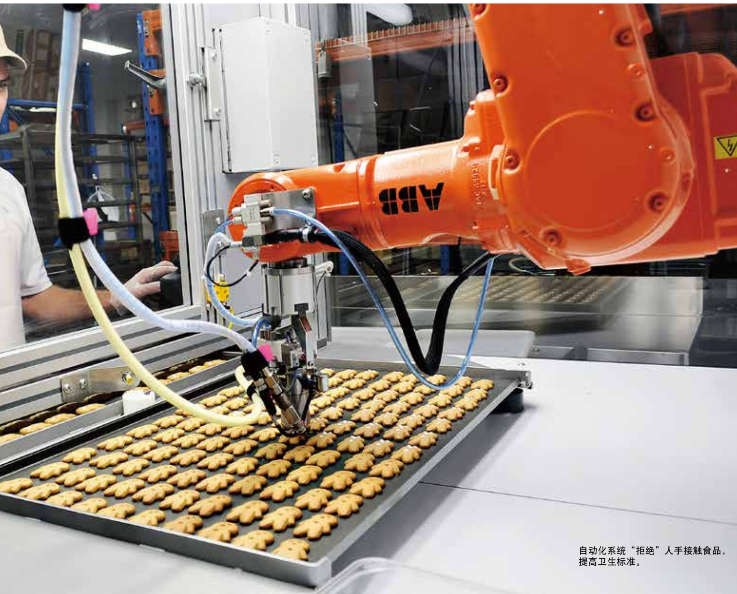
自动化系统“拒绝”人手接触食品，提高卫生标准。