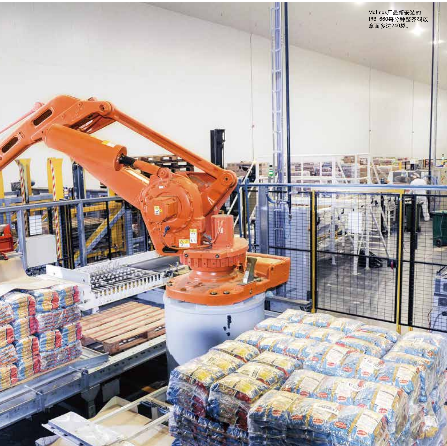
Molinos厂最新安装的 IRB 660每分钟整齐码放 意面多达240袋。