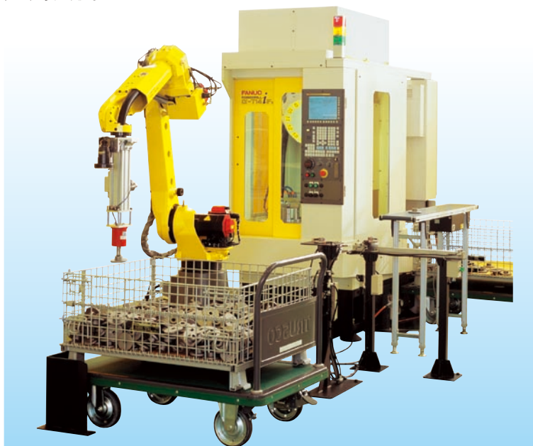
小型工件的散堆拾取